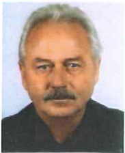
Van de voorzitter