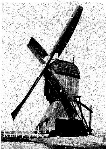
Wipmolen (poldermolen) bij Nieuwpoort (ZH)