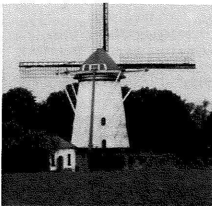
De Kekerdomse Molen "De Duffelt" (beltmolen). Let op de ingang van de belt.

DIVERSE TYPEN MOLENS Onder de Nederlandse windmolens bestaan diverse variaties. Naast de verschillende typen als b.v. wipmolen, standerdmolen en beltmolen, kennen de verschillende typen ook verschillende functies zoals: graan- papier- en poldermolen. Hoewel molenaar Gert Vierboom zijn Thornsche Molen steevast een wipmolen noemde was dit niet juist, ondanks de gelijkenis. De wipmolen is een kleine standaardmolen. Let op het grote schoepenrad in het voorbeeld. Hier betreft het een poldermolen. De kokerkorenmolen , de Thornsche Molen, daarentegen is een graanmolen, waarvan het bovenhuis draait op de koningsspil die in een koker door de gehele molen loopt. Uiteraard zijn beide afhankelijk van de wind. Dat is voor de molenaar een onzekere factor. Vandaar dat Gert Vierboom begin 20 ste eeuw een schuur bij de molen bouwde met daarin een petroleummotor, zodat hij niet meer afhankelijk was van de wind. De Kekerdomse graanmolen is een beltmolen . Deze is gebouwd op een belt/berg. In deze belt is een open ruimte gemaakt met brede toegangsdeur. De boer kan met kar en paard zijn graan in de molen afleveren. Als de molenaar zijn werk heeft gedaan, komt de bakker binnenrijden om de zakken met meel op te laden. Deze worden dan met een takel op de kar gelost.