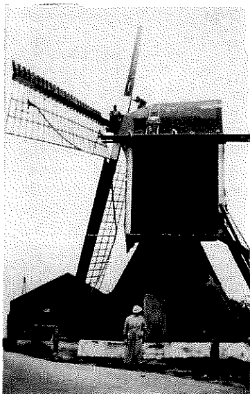
Thornsche molen, jaren dertig 20 de eeuw, (kokerkorenmolen)